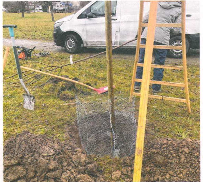
Schutz gegen Wühlmäuse